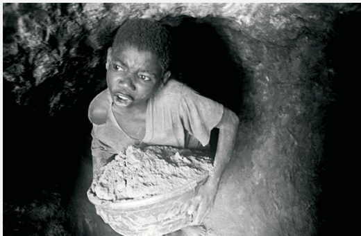
Child labor in a copper mine (Nigeria) Kinderarbeit in einer Kupfermine (Nigeria)

The Phoenix watches humans setting out to explore the world beyond their immediate surroundings. The courage and determination of the first explorers commands respect; but all too soon, greed, hubris, and the striving for hegemony take over. Mercenaries, bloodhounds, and missionaries man the exploration ships; foreign nations, cultures, and religions are disrespected and crushed by brutal force, their adherents sold as slaves; the natural resources of foreign continents are relentlessly exploited without any benefit for their rightful owners. The wealth of a few is built on the labor, suffering, and death of many. Colonialism creates imbalances in human society from which it will never fully recover.